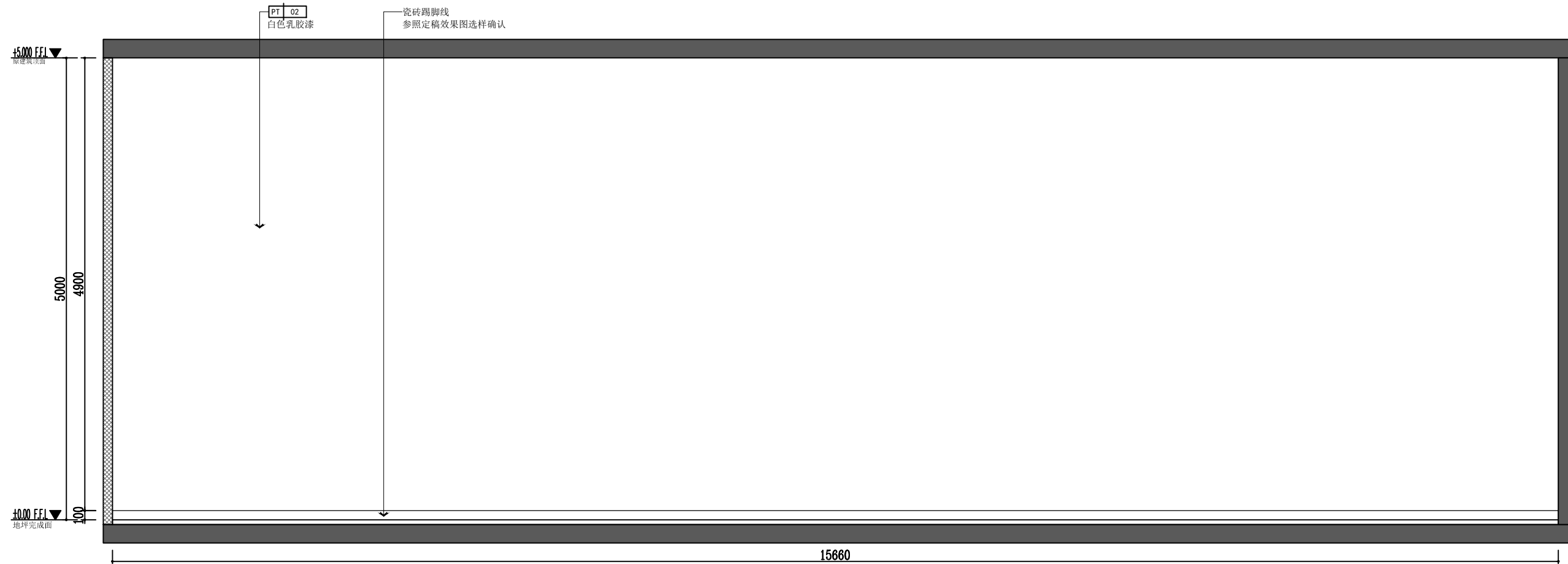
22 立面图 F-P-15 1:50

本图版权归——公司所有，未经许可，不得将任何部分翻印。切勿以比例度量本图，一切尺寸按图中数字标注为准。图纸未加盖本司印章者无效。